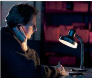
Elke dag is er wel ergens op de wereld een spraakmakende ontvoering of kidnap.