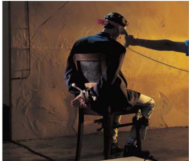
Politie, justitie en de experts van PIA Nassau Europe (CRI) weten het slachtoffer vrij te krijgen.

Een boeiende baan kan opeens levensbedreigend zijn. Wanneer een employé is ontvoerd, wordt van een organisatie verwacht dat deze alles zal doen om de medewerker (vaak expatriate) zo snel mogelijk vrij te krijgen. Meteen de losgeldeisen inwilligen, kan ingrijpende consequenties hebben voor bijvoorbeeld de liquiditeit en continuïteit. Veel dramatischer zijn de psychische gevolgen voor het slachtoffer en de familie... De Kidnap and Ransom Polis is bedoeld voor elke organisatie of vermogende particulier die met een ontvoering of een afpersing geconfronteerd kan worden.